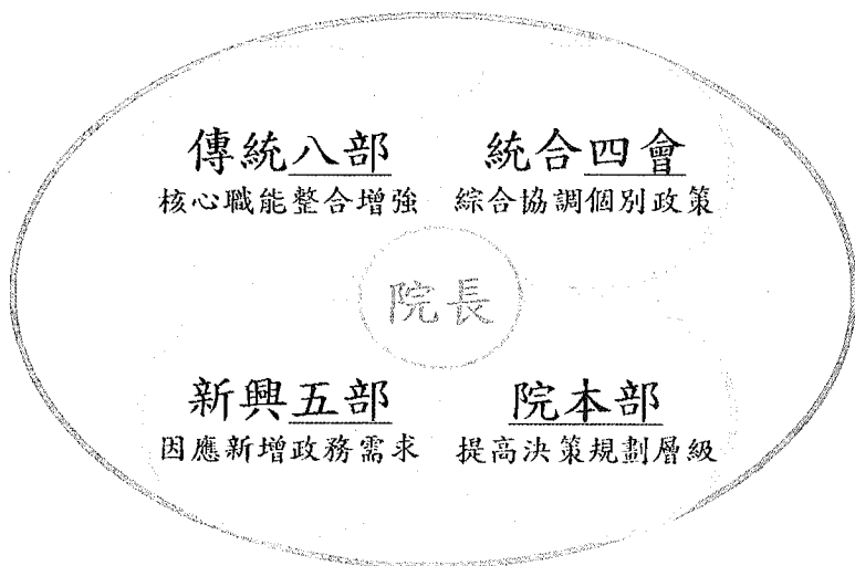
圖2 各部、委員會及院本部設置歸類

(四) 財政部主要業務包括國庫、賦稅、國有財產、新生地管理、國家資產、金融政策、促進民間參與公共建設、政府採購等。