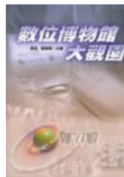
圖四：《數位博物館大觀園》

數位博物館專輯--《數位博物館大觀園》的製作與出版過程，為國科會同類型計畫中嶄新的創意與嘗試，而其意義更是影響深遠且彌足珍貴。本專輯不啻是數位博物館經驗的詳實記錄，試著以訪談的方式，從每一位計畫執行者的角度，剖析博物館學術內容、文化經營在資訊科技衝擊下的思維觸發，在數位潮流下的積極尋求傳統人文經營發展之變革調整。藉由三年的計畫經驗累積，不只能對於數位博物館同類型計畫，甚至廣泛對於數位學習、數位內容領域的發展，都有啟後傳承的意義。