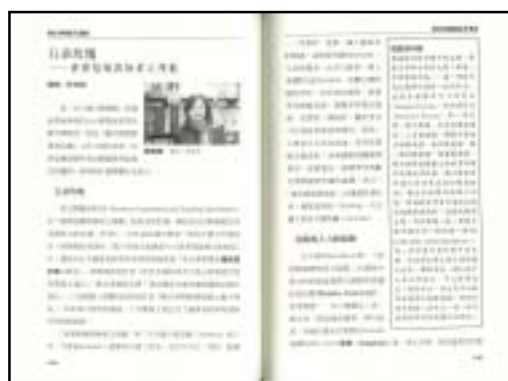
圖五：《數位博物館大觀園》內頁

專輯內容除了經驗傳承的文字記錄外，更希望站在使用者的角度，提供閱讀者更多的資訊與收穫。因此在計畫執行經驗分享的文章外，也在其中加入了實用性資訊，包括：中小學老師所分享的數位博物館教案設計經驗、七大領域對照表，所有網友利用網站素材所需注意的法律常識，讓入門者更容易上手瞭解的名詞解釋，以及各數位博物館代表性的量化資料呈現等等，讓本專輯除了軟性的題材外，更具有一般民眾深入數位博物館領域的參考價值。