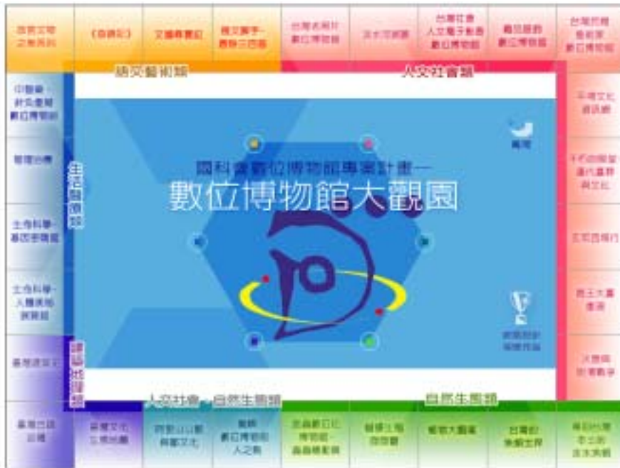
圖一：數位博物館大觀園 DVD 首頁