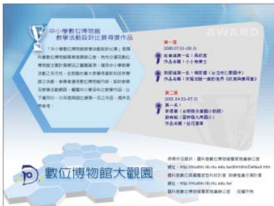
圖三：數位博物館大觀園 DVD 教學活動設計比賽作品 點選頁面