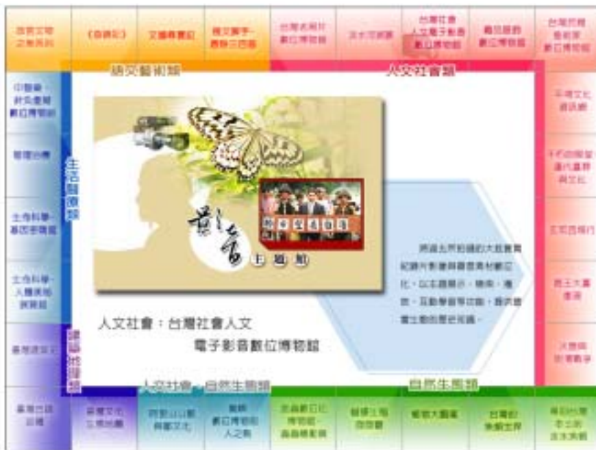
圖二：數位博物館大觀園 DVD 主題點選畫面