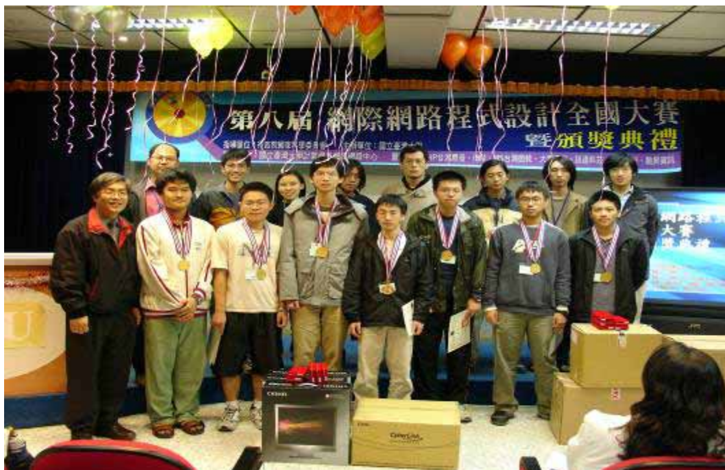
※得獎同學與今年裁判合影