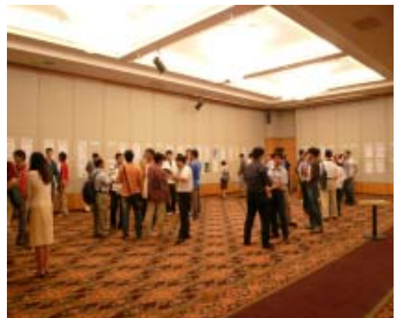
圖六、精簡報告展覽制度(VLSI/CAD)

本年度學門建立之精簡報告展覽制度為在成果發表會議前約三個月邀請微電子領域學者自行製作 A3 size 之直式海報一張，於八月及 12 月成果發表會場張貼如圖六。海報內容為各學者本年度研究成果，主要分為計畫簡介、研究項目適用領域、主要具體貢獻三部分。除了海報成果展覽制度外，學門更建立了海報評審制度，評審表之結果選項分為，成果表現豐碩、平實、以及未張貼三項選項如圖七。利用參與會議之學者互相評審觀摩，可以鼓勵微電子領域之學者將自己最佳之研究成果互相分享，如此更有助於國內微電子領域的交流與發展。