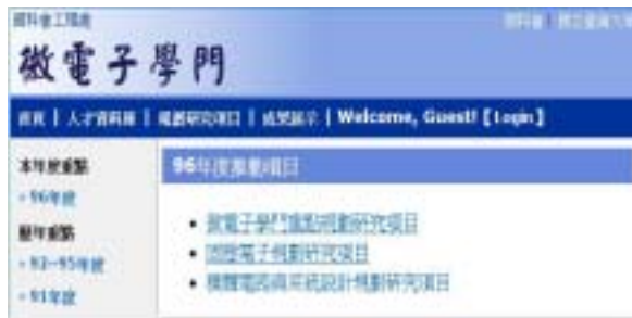
圖一、微電子學門年度重點研究項目