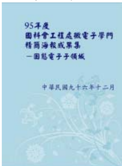
圖五、固態電子子領域成果集