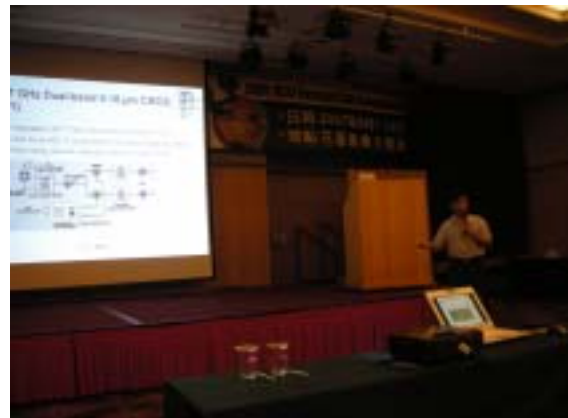
圖十一、多年期計畫主持人口頭報告

學門成果發表會中並邀請 95 年度多年期(三年)結案計畫之主持人於學門成果發表會中進行口頭報告圖十一。分別為積體電路與系統設計共六位，固態電子領域共 12 位。內容為各多年期計畫主持人近年來之重要研究成果與心得，透過口頭報告的方式以及問題交流的方式，讓參與成果發表會的學者有機會與各主持人進行雙向研討，更有助於國內增進國內微電子領域交流的機會。