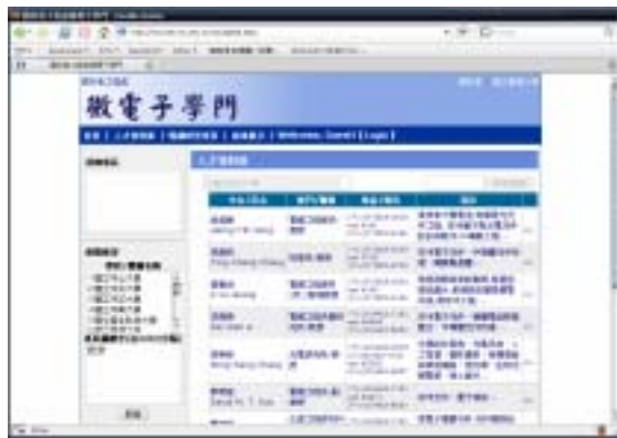
圖二、人才資料庫「專長」搜尋功能

微電子學門網站為學界、產業界、以及國科會的最重要聯絡窗口。因此在本學門網站上提供了包括最新學門公告及代刊訊息、重點規劃研究項目、學門人才資料庫及年度成果展示等資訊供外界瀏覽。本年度執行在此項目執行的重點為積極推動更新學門人才資料庫中各項資訊，並提供學門教師可自行在網頁上隨時更新資料的權限。此外，網站人才資料庫並提供以「專長」搜尋學者聯絡資訊的功能如圖二，可直接搜尋到全國相關領域的學者專家，以作為各界學術交流之參考。