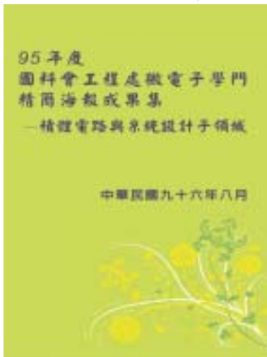
圖四、積體電路與系統設計領域成果集