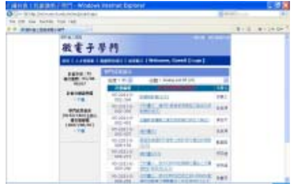
圖三、本年度之計畫成果展示

資料庫方式，收集全國年度最新成果報告資訊。並於兩大成果發表會結束後，將教師之精簡成果報告，開放於網頁上交流。能讓國內各學者互相觀摩最新的研究成果，以激盪出創意，以及尋求研究合作的機會。