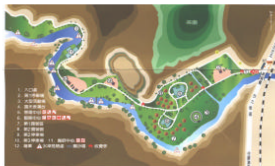
休閒農業、發展和特色