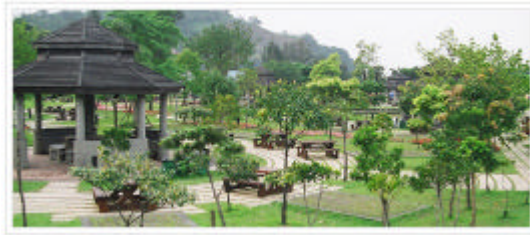
休閒農業、發展和特色