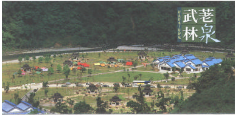
休閒農業、發展和特色