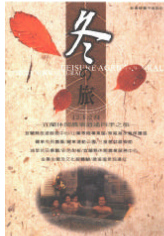
休閒農業、發展和特色