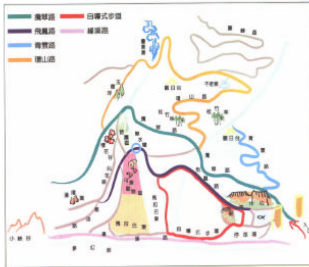
休閒農業、發展和特色