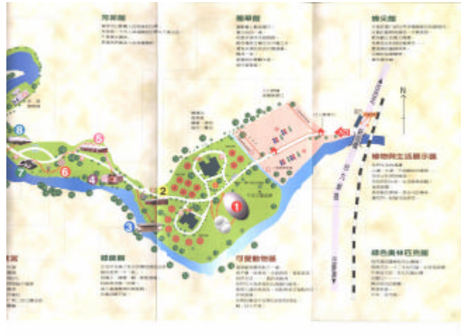
休閒農業、發展和特色