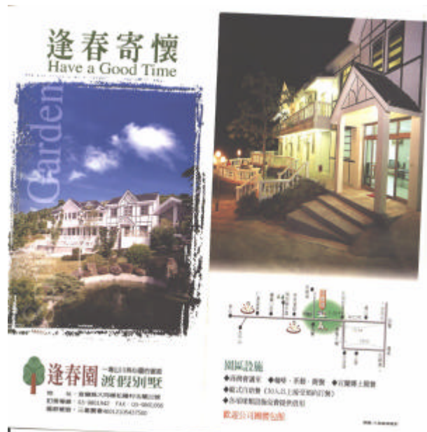
休閒農業、發展和特色