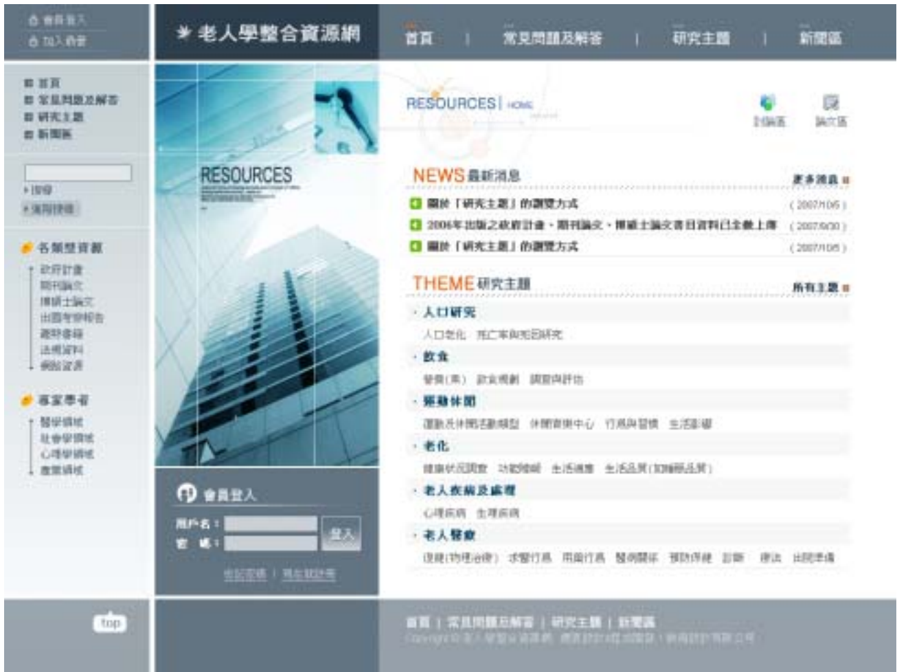
附錄二 老人學整合資源網網站架構示意圖