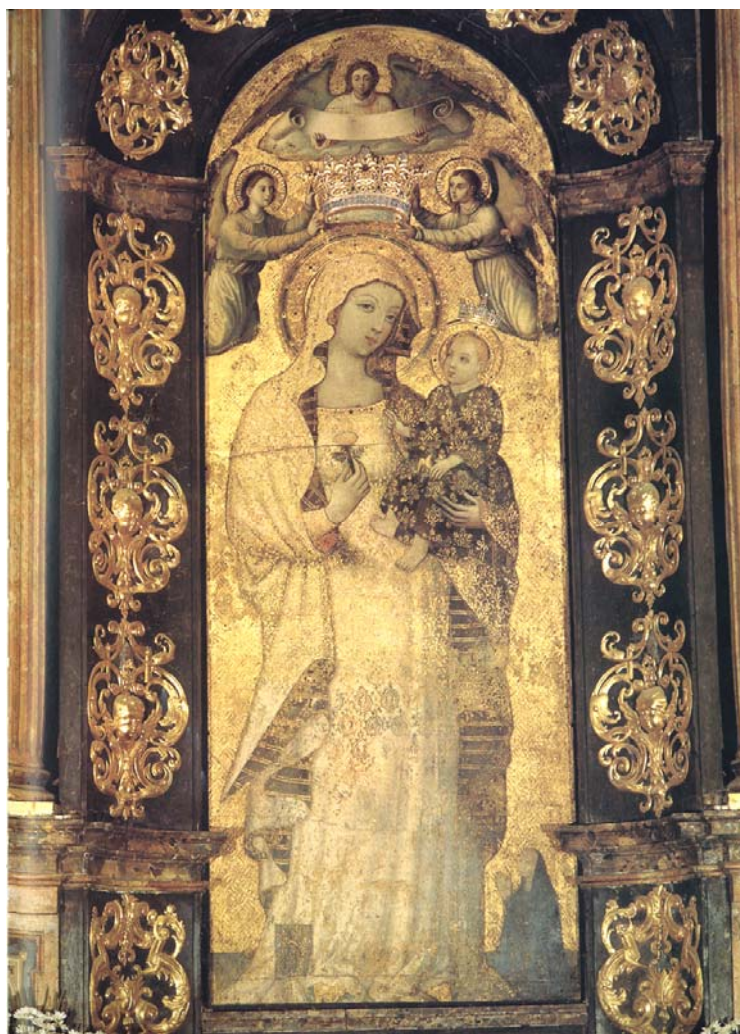
圖六 聖母古像 Virgen de La Antigua ，約 13-14 世紀或更早，濕壁畫， 西班牙塞維爾大主教座堂。