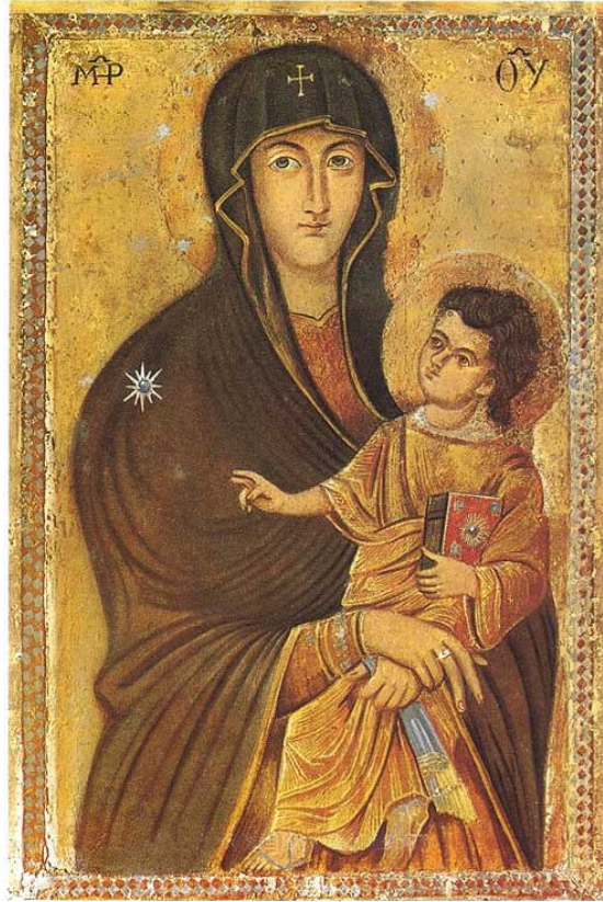
圖一 羅馬大聖母堂（Santa Maria Maggiore, Rome） 聖路加式（St. Luke）聖母抱子像，木板上彩。

澳門聖若瑟修道院（St. Joseph's Seminary, Macao）也藏有同一型式、繪於同一木板正反面的兩幅聖母抱子油畫（圖二），它們或是稍晚寄自歐洲，或於澳門當地再仿，無法證實，不過可從此本推想送給萬曆的聖母像樣貌。 18 利氏在《基督宗教傳入中國史》中記述，皇帝震驚於