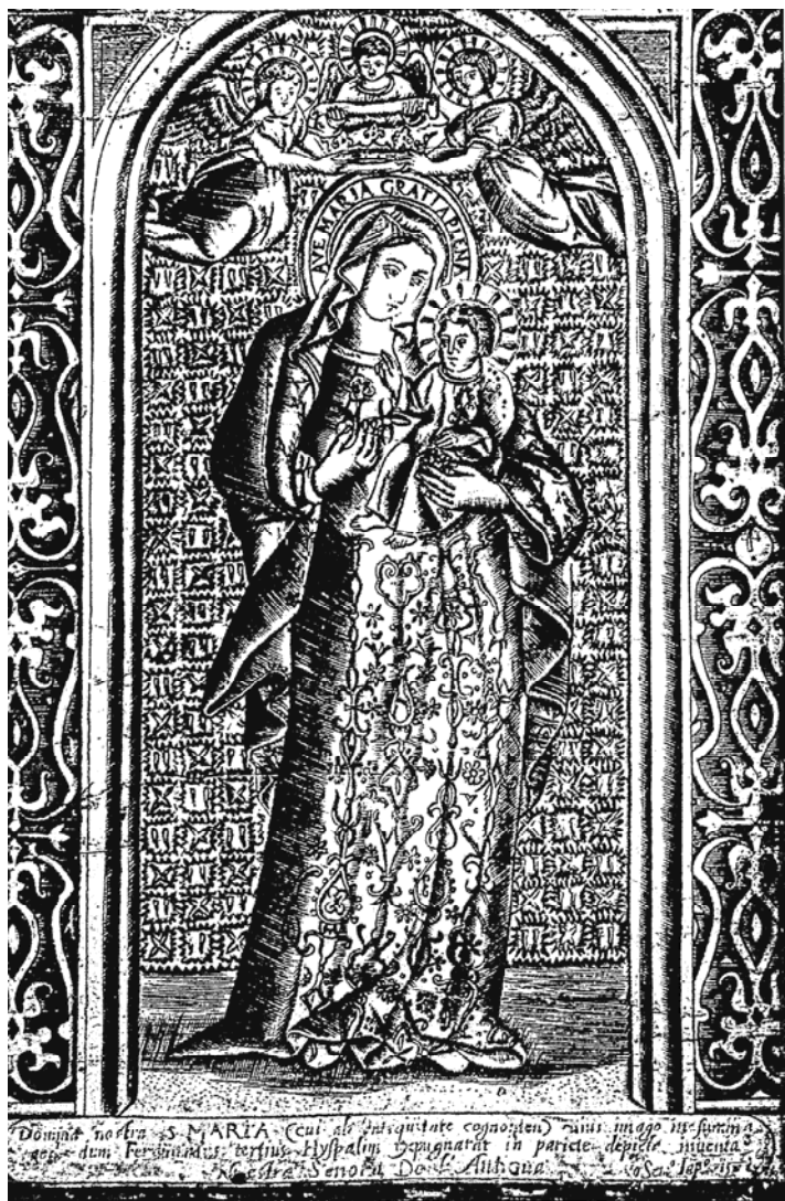
圖五 塞維爾聖母像，1597年，銅版印刷，22*14.5公分，日本有家耶穌會學院（有家町，今南島原市），日本長崎大司教區（Catholic Archdiocese of Nagasaki）藏。