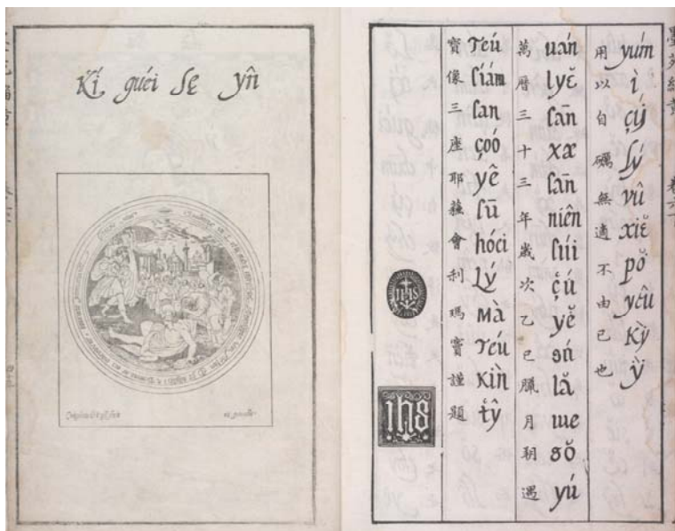
圖十 〈淫色穢氣〉（左），及〈二徒聞實〉文字最後一頁（右），《程氏墨苑》。