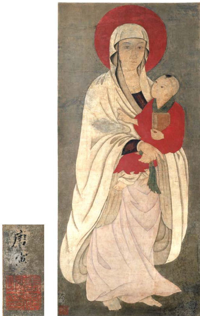
圖三 仿聖路加式聖母聖像，17-18 世紀(?)，紙本卷軸絲裝上彩，西安， 美國芝加哥菲爾德博物館 (The Field Museum, Chicago, U.S.) 藏。

©圖片及版權：The Field Museum, Image No. A114604_02d, No. A114604_08d, Cat. No. 116027, Photographer John Weinstein.