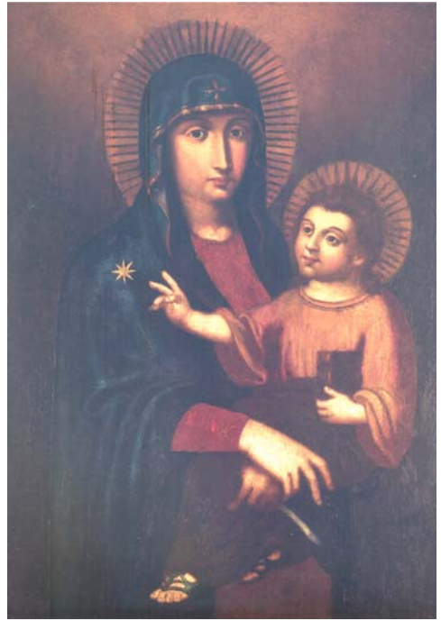
圖二 聖母抱子像，約 17-18 世紀，銅板油彩，一版兩面，98*76 公分，澳門聖若瑟修道院聖母堂藏。