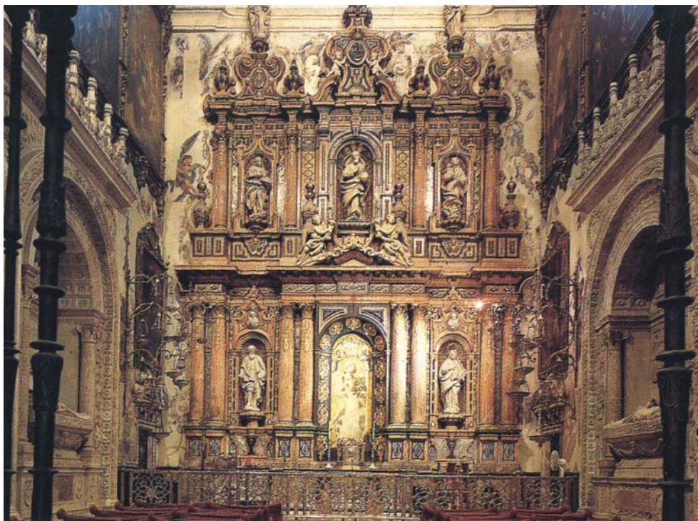
圖七 聖母古像 Virgen de La Antigua 禮拜堂，西班牙塞維爾大主教座堂，聖母古像在下方中間主龕。