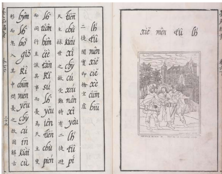
圖九 〈二徒聞實〉圖及文字，《程氏墨苑》。