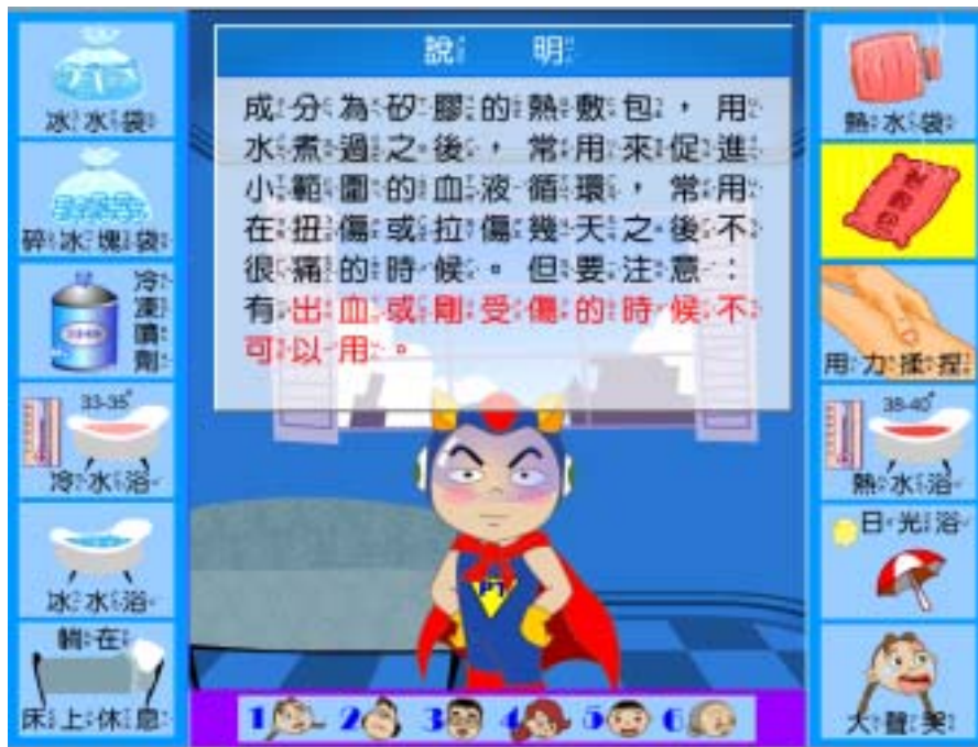
圖十 兒童館互動遊戲練功房的介面設計

此外，兒童館並有一支電腦操的錄影帶，由學童喜愛的櫻桃妹妹來示範打電腦一小時必須休息的電腦操。