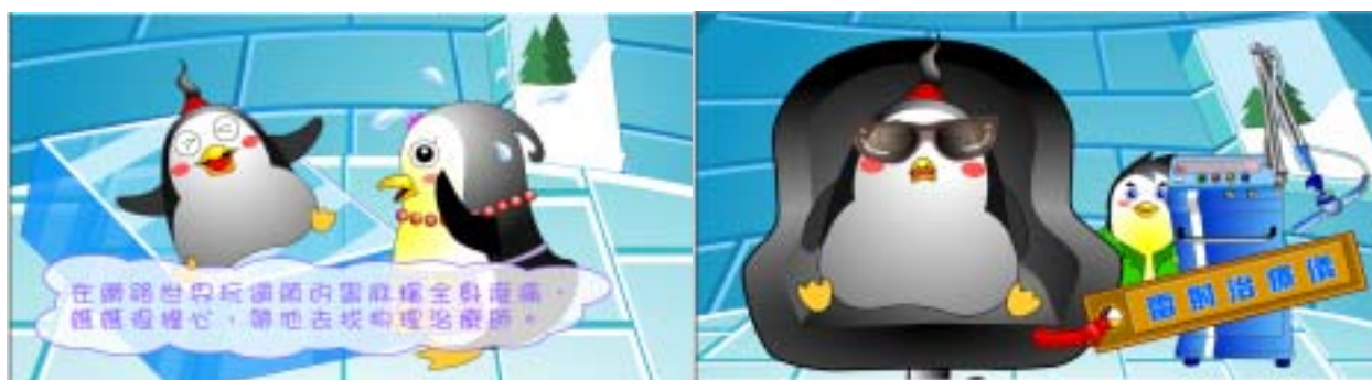
圖十五 神奇的雷射光之部分完成圖

但是大家不要忘記了，眼睛是會聚光，所以做雷射治療的時候，要戴特製的眼鏡，並且不要用眼睛直視。