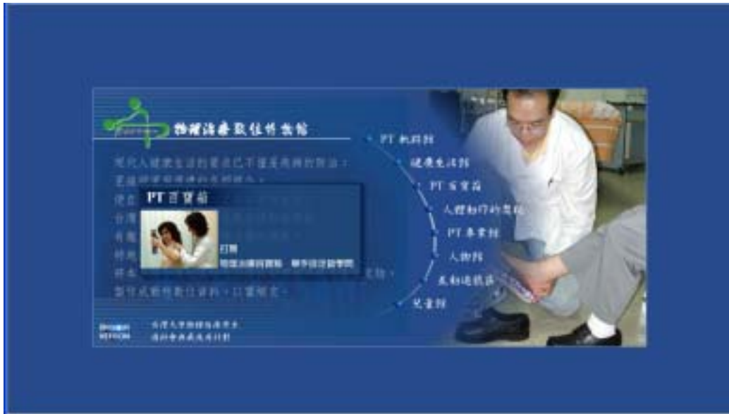
圖四：中文版主網頁連結 PT 百寶箱之介面顯示