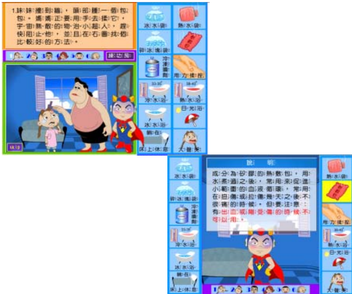
圖十八 冷與熱之部分問題區與練功房