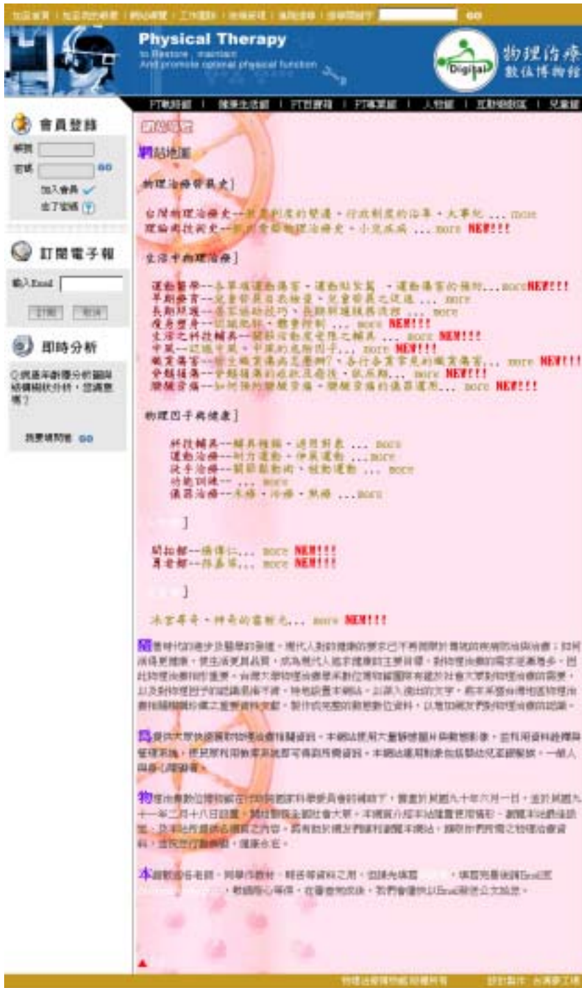
圖十三 網站導覽主網頁之介面設計

網站導覽主要包括本網站設置背景、日期與內容介紹。根據規劃，此單元亦為本計畫所設計。