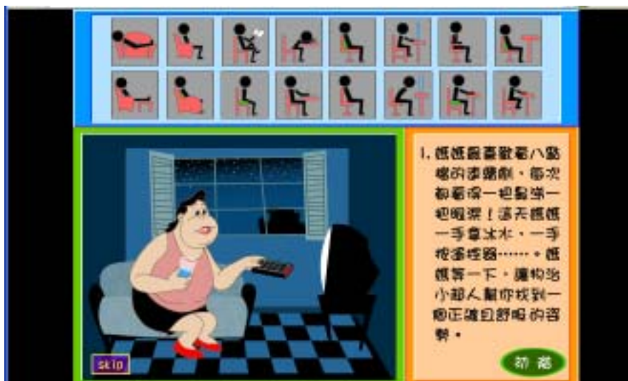
圖九：兒童館之「坐有坐相」互動遊戲部分畫面

至於互動遊戲部分，則利用五到六個不等的問題，採用選擇題的回答方式，使學童由回答問題中去學習正確的答案，並導入物治小超人做正確的解答，其介面如圖九。互動遊戲一共有三個單元，包括「坐有坐相」、「冷與熱」、「對付扭傷」等三個互動遊戲。坐有坐相單元則是提供不同的場景，讓學童學習正確的坐姿。冷與熱單元則是學習冷敷與熱敷的使用，而對付扭傷單元，則是提供扭傷的進展過程，使用不同的處理方式。