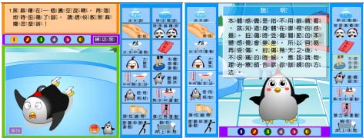
圖二十：對付扭傷之部分問題區與練功房