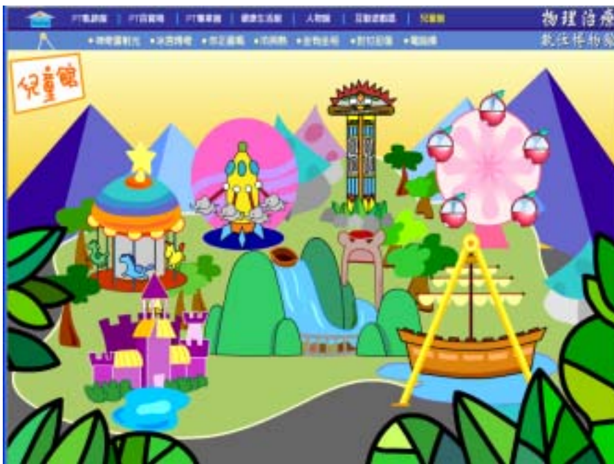
圖七：兒童館主網頁之介面呈現

為吸引兒童目光，兒童館之主網頁的網頁呈現，與其他主題館網頁大相逕庭，以呈現活潑步調的五彩圖案為主要風格。底圖其版面設計，如圖七所示，係採兒童熟悉之遊樂場畫面，每一遊樂活動均為一起連結，分別連結「冰宮傳奇」、「你正直嗎?」、「神奇雷射光」等三部物理治療相關的故事動畫，「坐有坐相」、「冷與熱」、「對付扭傷」等三個互動遊戲，以及使用電腦時中場休息的「電腦操」的錄影帶。