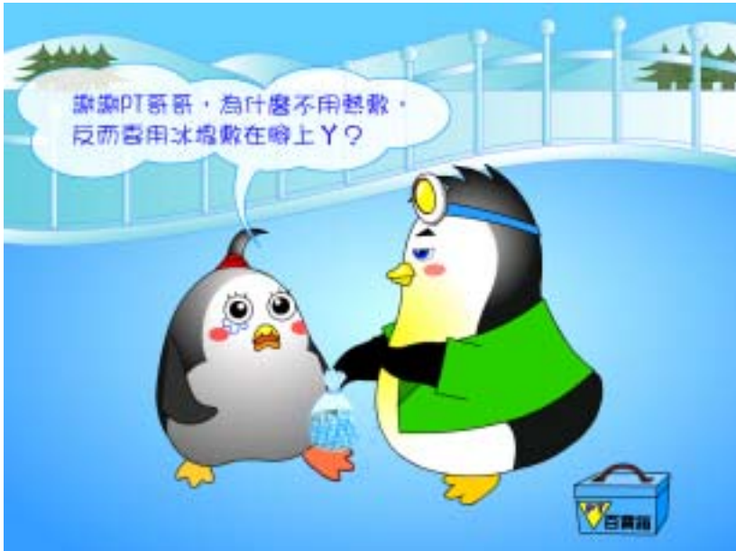
圖八：兒童館之「冰宮傳奇」動畫部分畫面

單元是黑麻糬腳踝扭傷的時候使用冰府來消腫止痛的故事，「你正直嗎？」單元則敘述黑麻糬發現脊柱側彎的故事、「神奇雷射光」則為雷射於醫療上運用的故事。