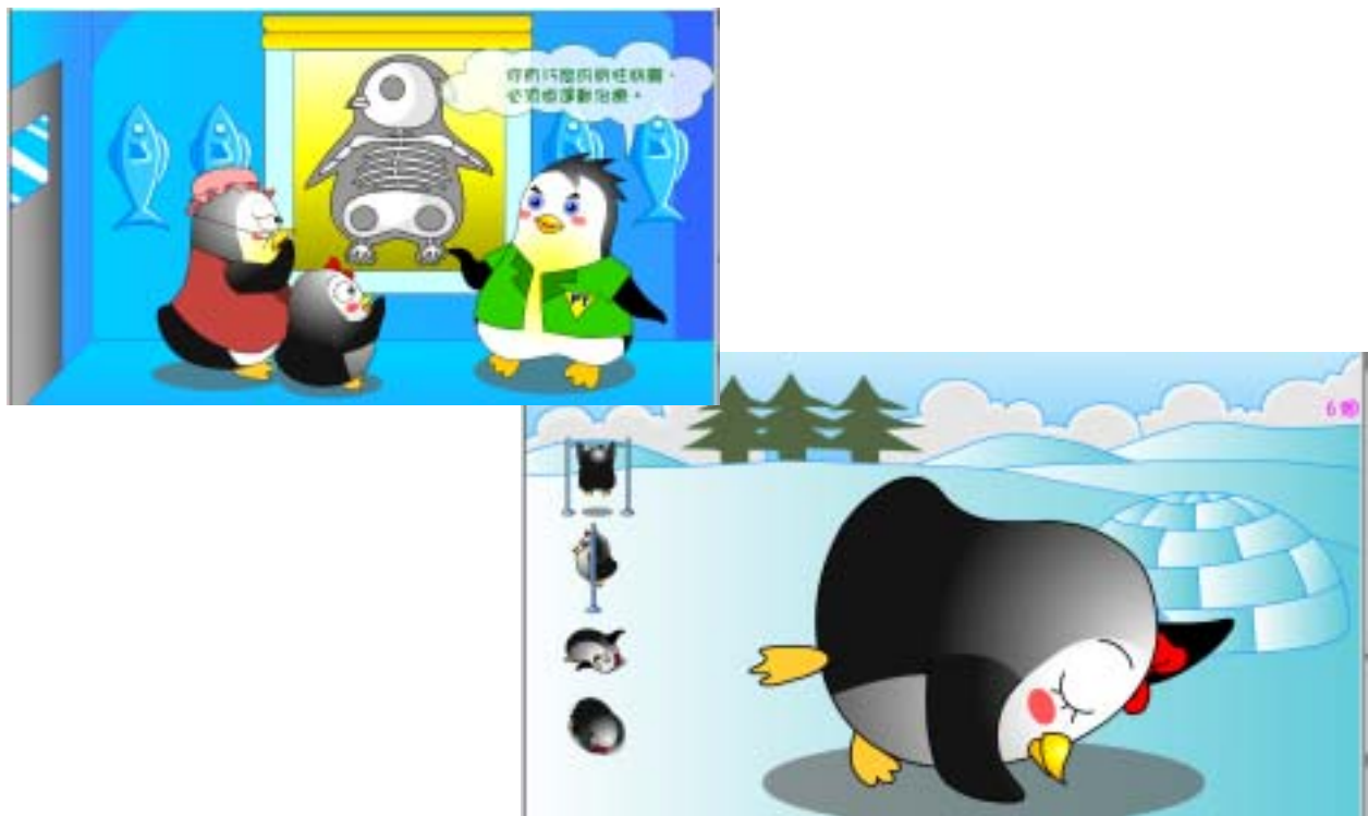
圖十六 你正直嗎之部分完成圖

黑麻糬快快樂樂地穿著裙子和阿媽在逛街去了，路上碰到該物理治療師，物理治療師告知黑麻糬做運動的原理。並且說：「脊椎不正直不打緊，做人正正直直就最重要了！」