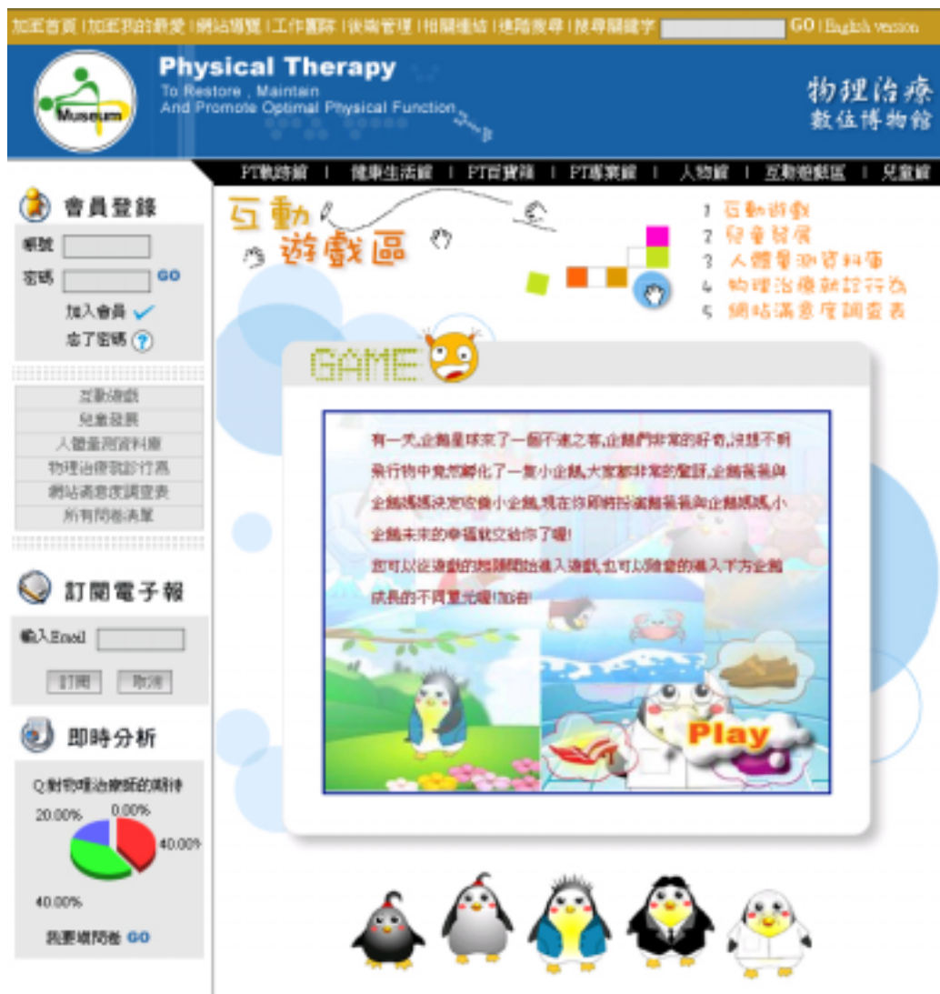
圖十二 電子企鵝互動遊戲主網頁之介面設計

「互動遊戲」則是透過飼養電子企鵝，隨著生活中發生的狀況，提供不同的問題，使兒童或成人學習人生不同階段與物理治療相關的常識。其介面設計如圖十二。本單元之青少年及成人階段的問題乃本計畫成員所設計。