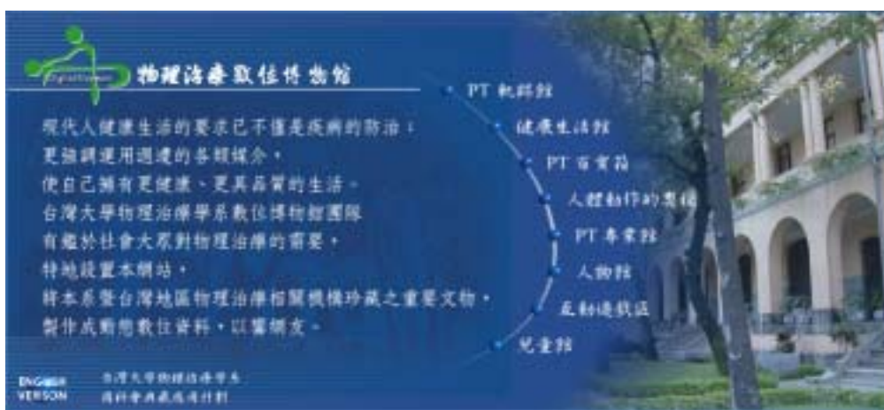
圖三 物理治療數位博物館中文版主網頁之介面設計

理治療師及建置物理治療數位博物館的台大醫學院一景。左側則為建置物理治療數位博物館的精神與說明。右側則有八個主要圖示(icon)，代表本數位博物館的四大主題，包括 PT 軌跡館、健康生活館、PT 百寶箱、人體動作的奧妙、PT 專業館、人物館、互動遊戲區、兒童館、網站導覽、及國科會數位博物館計畫與本系之網站。除人體動作的奧妙尚未建館外，其餘皆可由此直接進入各主題館，暨國科會數位博物館、台大物理治療學系網站。