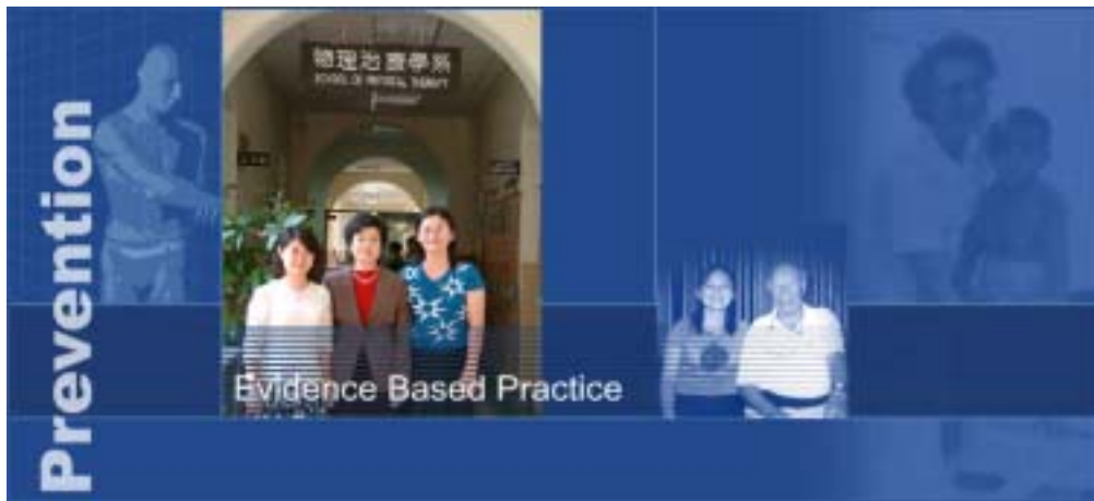
圖二：物理治療數位博物館首頁之靜態呈現

物理治療博物館的首頁設計，是以 Flash 軟體撰寫的動態網頁，強調物理治療的醫學科技與人文關懷為主要風格。其背景右側為輪椅使用者由輪椅站起來，大步前行，邁向光明的未來，表示物理治療對病患的貢獻之一。左側則以連續出現各類人體的基本動作，為物理治療師的治療手法—PNF 的呈現，強調動作與醫學的結合；並以英文字指出物理治療的目標。中間則為清晰的圖片呈現物理治療師工作的領域。全圖使用藍色的為基本色調，代表物理治療師的冷靜與理智。首頁動畫之靜態圖樣如圖二：