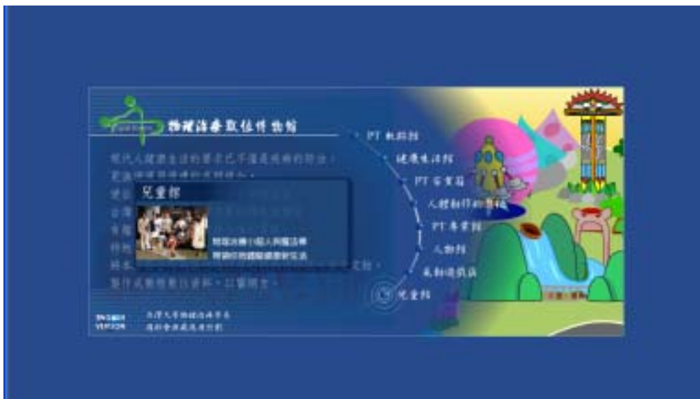
圖五：中文版主網頁正在連結兒童館之介面顯示