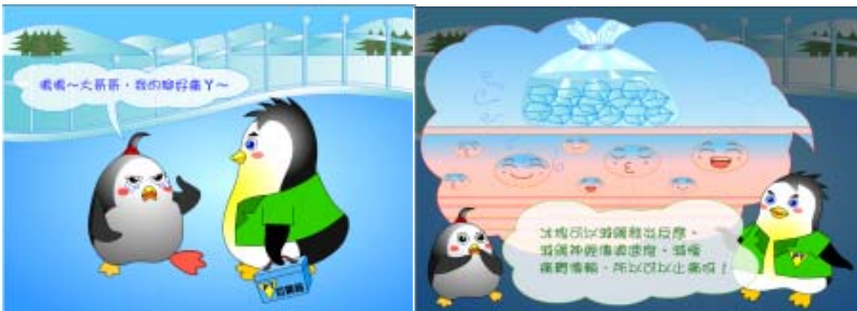
圖十七 冰宮傳奇之部分完成圖

一陣子後，黑麻糬感覺到不那麼疼痛了，於是起來問 PT 哥哥：「冰還可做什麼？」於是哥哥就告訴黑麻糬冰還可以做冰按摩。黑麻糬很驚訝，問哥哥可否體驗一下，於是哥哥帶黑麻糬回家，從冰箱拿出他之前就準備好的冰按摩棒，黑麻糬感覺很特別，因為體驗到從未體驗到的感覺，又覺得對他受傷的手有很舒服的感覺，最後黑麻糬還說，冰還可以做成冰棒吃呢！