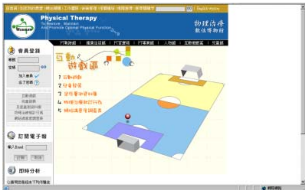
圖二十一 互動資料庫的介面設計完成圖

互動遊戲區包含互動遊戲、兒童發展、足底量測資料庫、物理治療就診行為、網站滿意度調查表等互動區。本計畫負責足底量測資料庫之規劃與執行。其主網頁之介面如圖二十。