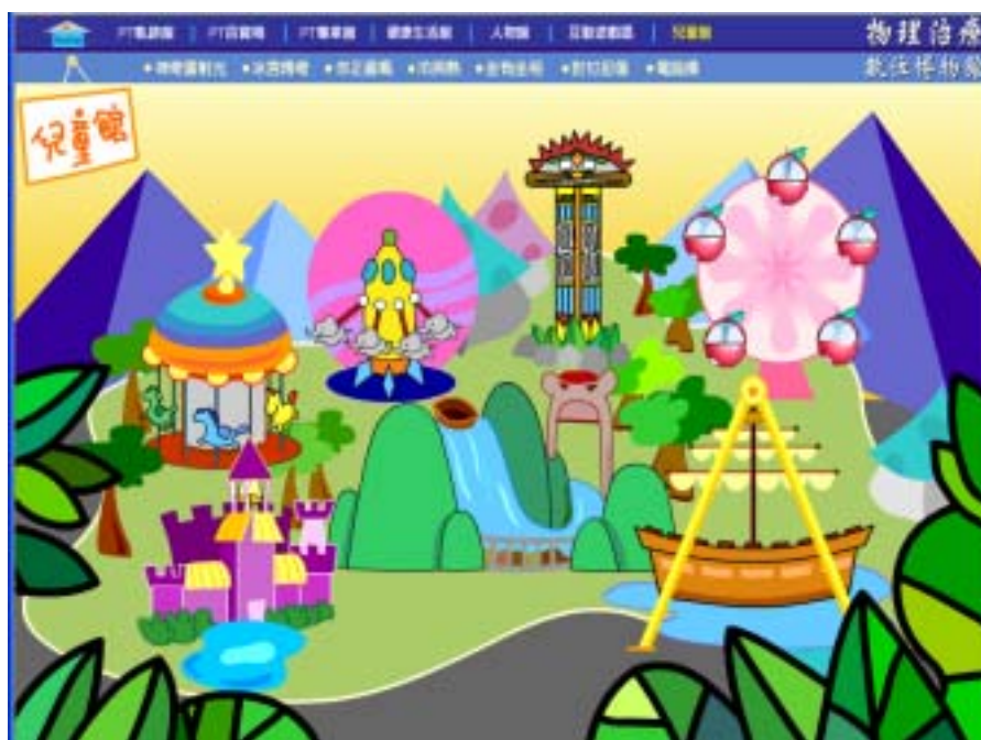
圖十四 兒童館主網頁之介面設計圖及其完成圖