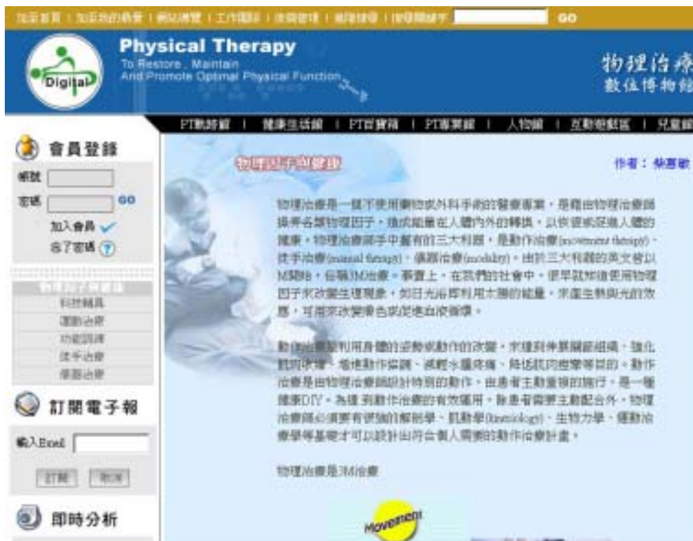
圖六：PT 百寶箱之主網頁版面

網頁的呈現，一如其他主題館網頁，以呈現健康色調的底圖為主要風格。底圖其版面設計，如圖六所示。網頁左側有會員登錄、訂閱電子報、及時分析等連結。網頁上端為回首頁、加至我的最愛、網站導覽、工作團隊、後端管理、相關連結、搜尋等超連結，並將層次段落標記於內容上列，以方便瀏覽者使用。